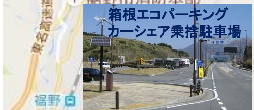
カーシェアステーション